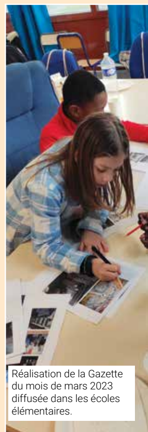
Réalisation de la Gazette du mois de mars 2023 diffusée dans les écoles élémentaires.