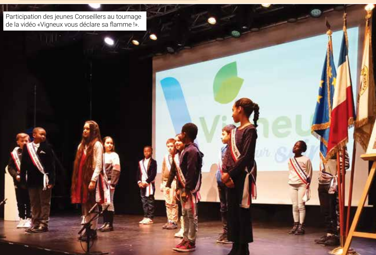
Participation des jeunes Conseillers au tournage de la vidéo «Vigneux vous déclare sa flamme !».