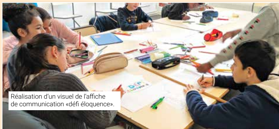
Réalisation d'un visuel de l'affiche de communication «défi éloquence».