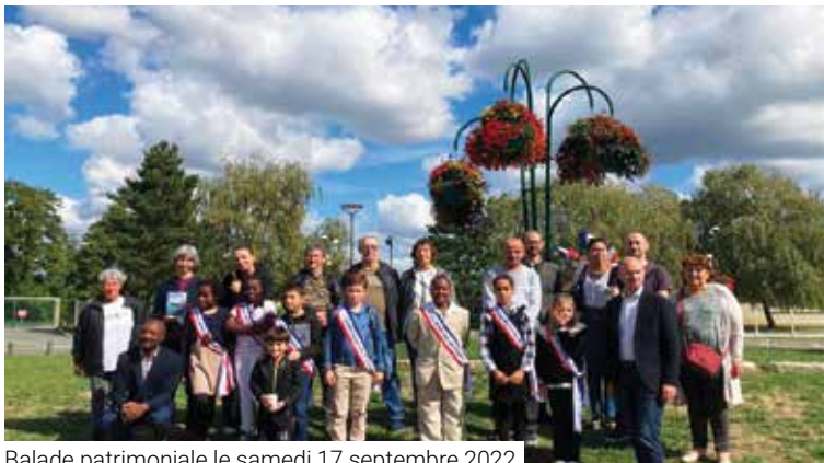
Balade patrimoniale le samedi 17 septembre 2022