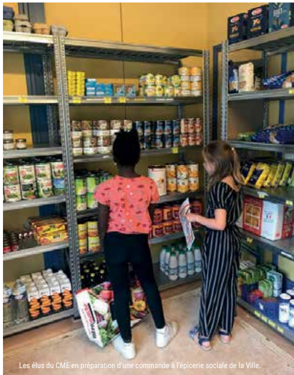
Les élus du CME en préparation d'une commande à l'épicerie sociale de la Ville.

Nos jeunes élu(es)s sont solidaires ! Ils ont, dans un premier temps, participé à un atelier à l'épicerie sociale dont l'objectif était de découvrir un dispositif solidaire. Ils ont ainsi appris comment fonctionne ce service municipal. Puis, ils ont pu préparer une commande avec des aliments afin de les sensibiliser sur la gestion technique d'une épicerie. A cette occasion, ils se sont rendus compte de l'intérêt de l'esprit solidaire pour penser à la fois à soi et aux autres. Les jeunes élu(es)s ont ensuite mis en pratique leur savoir-faire en participant activement à la collecte solidaire organisée samedi 25 juin au magasin Intermarché. Ils ont abordé directement les personnes pour recueillir des dons et ont pleinement rempli leur rôle d'élu, avec le sourire. Les enfants du CME souhaitent agir concrètement pour leur ville, notamment en organisant une nouvelle collecte de dons, avec l'épicerie sociale, fin septembre et début octobre dans toutes les écoles élémentaires.