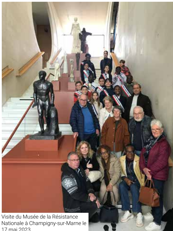
Visite du Musée de la Résistance Nationale à Champigny-sur-Marne le 17 mai 2023