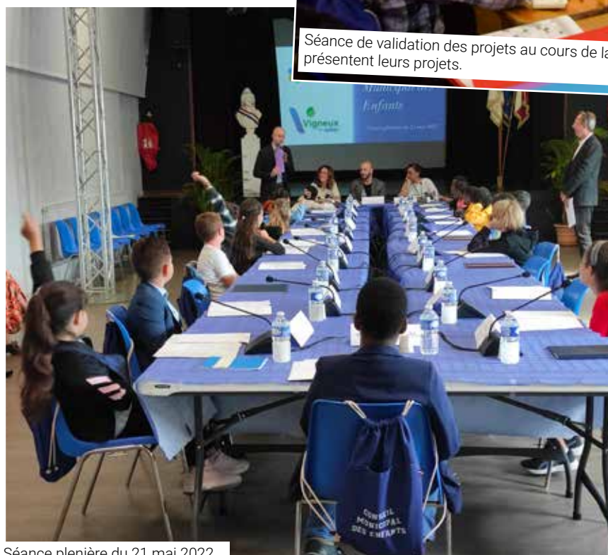
Séance plénière du 21 mai 2022.