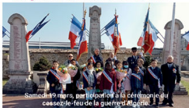
Samedi 19 mars, participation à la cérémonie du cessez-le-feu de la guerre d'Algérie.