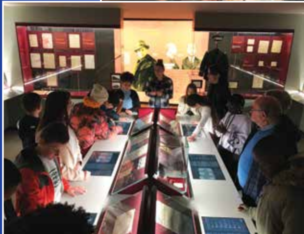
Mercredi 17 mai 2023, le CME invité par l'Association Républicaine des Anciens Combattants de Vigneux-sur-Seine au musée de la Résistance Nationale à Champigny-sur-Marne et un déjeuner au restaurant.