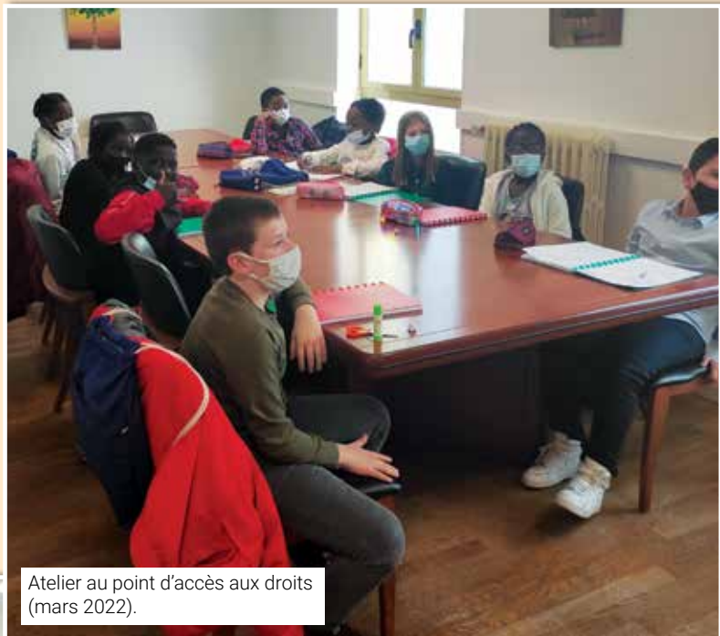
Atelier au point d'accès aux droits (mars 2022).