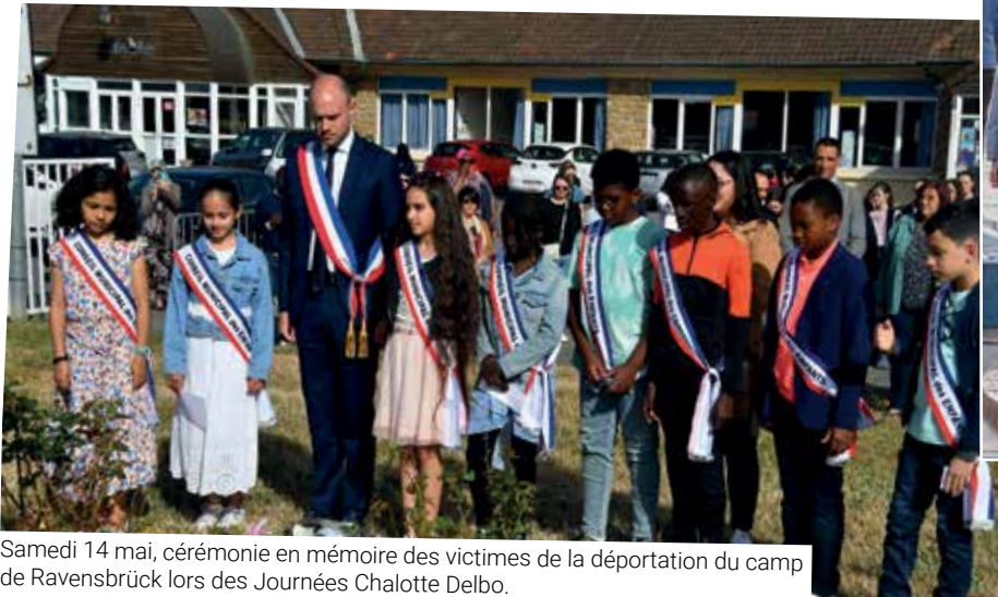
Samedi 14 mai, cérémonie en mémoire des victimes de la déportation du camp de Ravensbrück lors des Journées Charlotte Delbo.