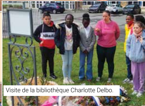
Visite de la bibliothèque Charlotte Delbo.