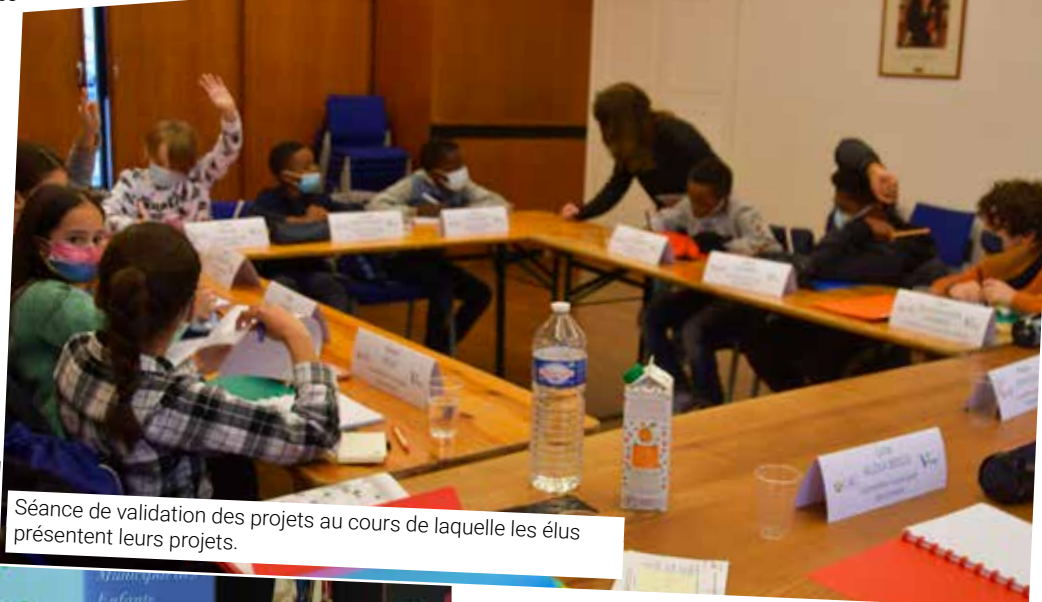
Séance de validation des projets au cours de laquelle les élus présentent leurs projets.