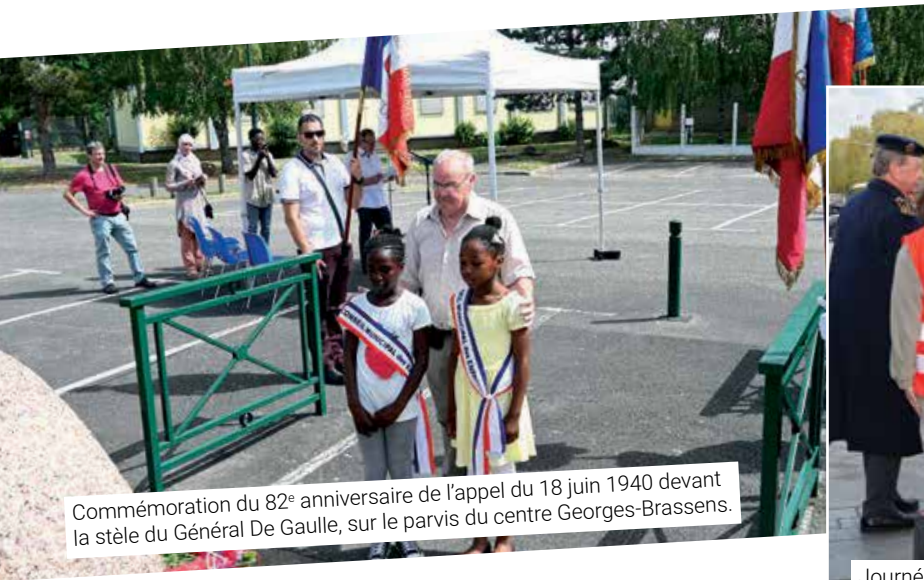
Commémoration du 82 e anniversaire de l'appel du 18 juin 1940 devant la stèle du Général De Gaulle, sur le parvis du centre Georges-Brassens.