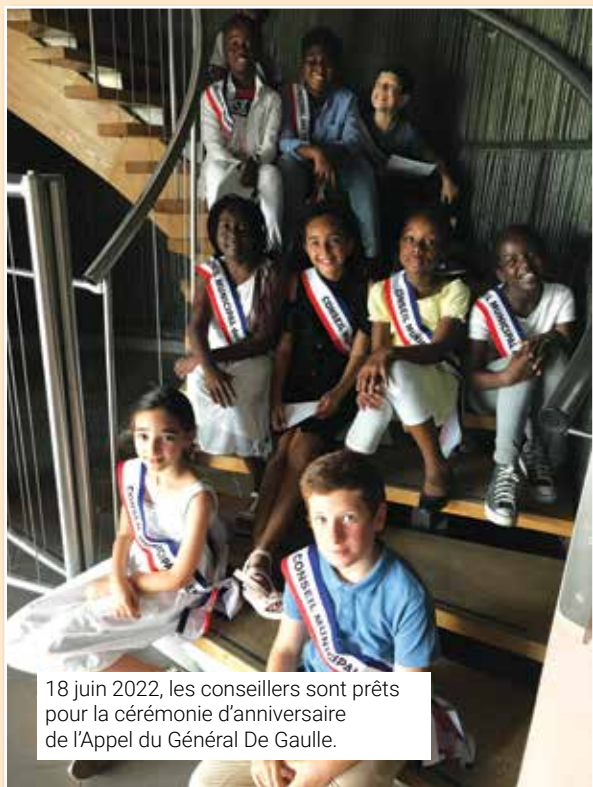
18 juin 2022, les conseillers sont prêts pour la cérémonie d'anniversaire de l'Appel du Général De Gaulle.