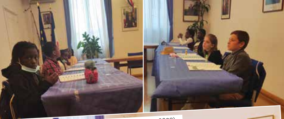
Atelier à la salle des mariages (février/mars 2022).