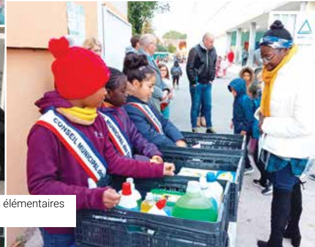
Collecte solidaire dans les écoles élémentaires de Vigneux-sur-Seine.