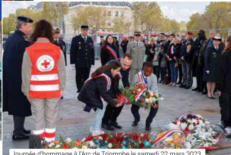
Journée d'hommage à l'Arc de Triomphe le samedi 22 mars 2023.