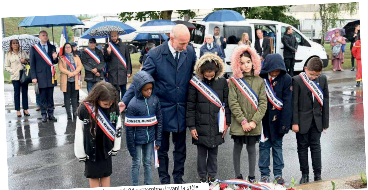
Cérémonie des martyrs de la Longueiraie samedi 24 septembre devant la stèle de la Longueiraie, en présence de Jean-Raymond Hugonet, Sénateur de l'Essonne.