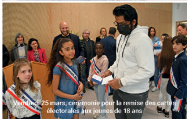
Vendredi 25 mars, cérémonie pour la remise des cartes électorales aux jeunes de 18 ans