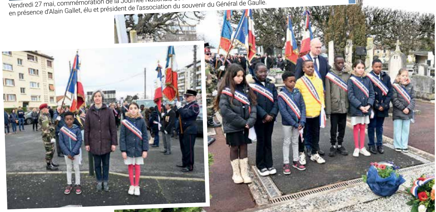
Commémoration du 61 e anniversaire du Cessez-le-feu en Algérie.