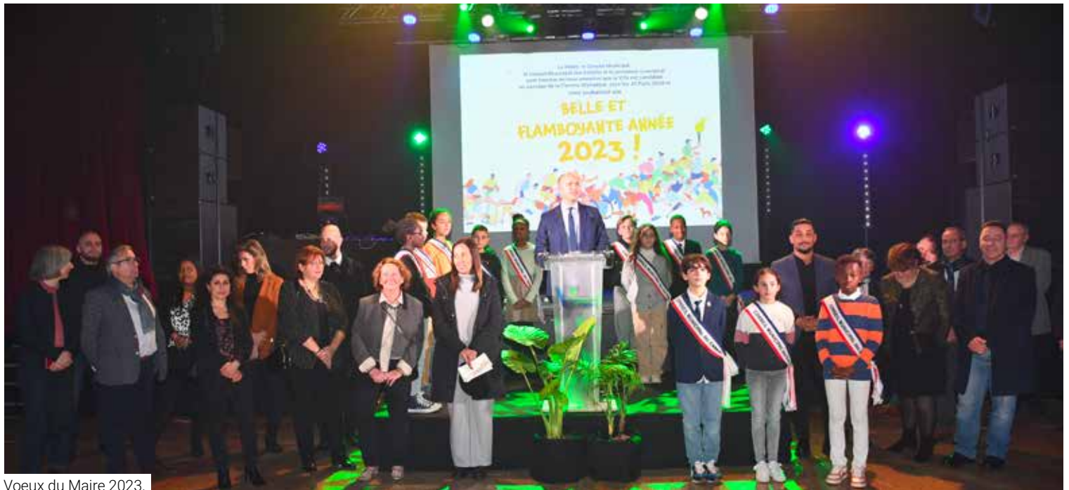
Voeux du Maire 2023.

Les membres du CME ont été également associés aux manifestations et festivités locales.