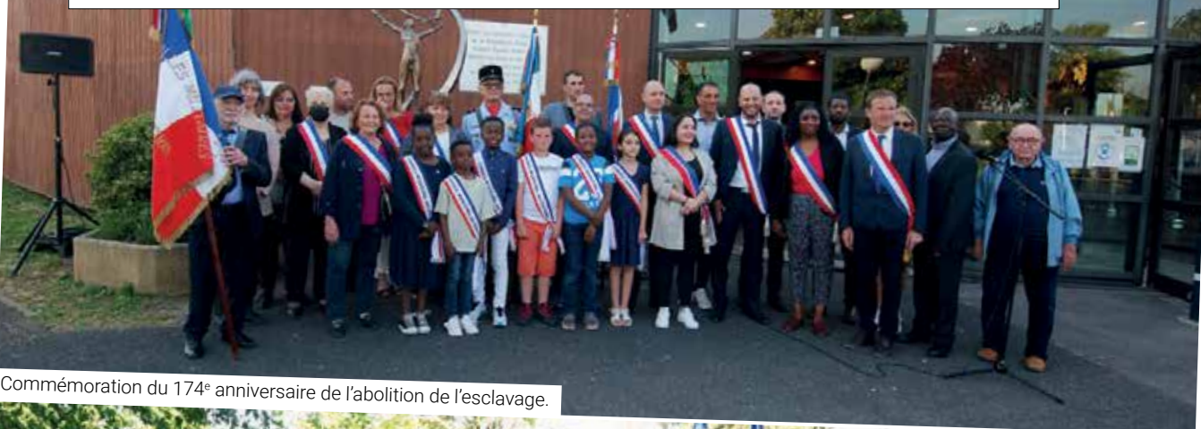
Commémoration du 174 e anniversaire de l'abolition de l'esclavage.

Les Conseillers ont participé à 12 cérémonies commémoratives à côté des élus et des associations Anciens Combattants et patriotique