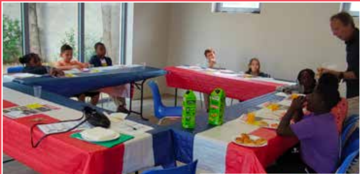
Visite de l'épicerie sociale «Horizon Solidaire»