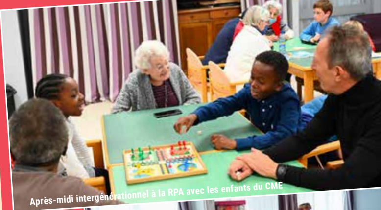
Après-midi intergénérationnel à la RPA avec les enfants du CME