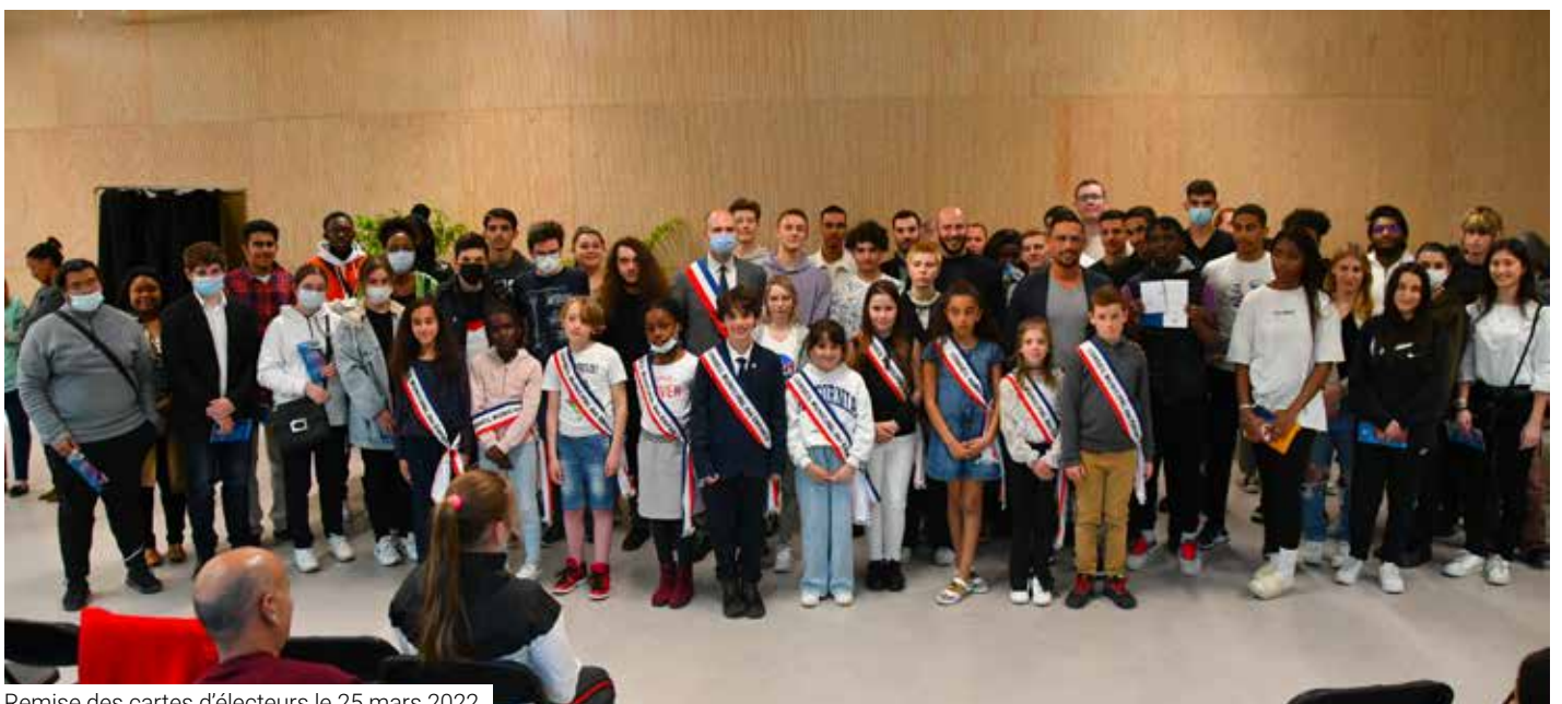
Remise des cartes d'électeurs le 25 mars 2022.