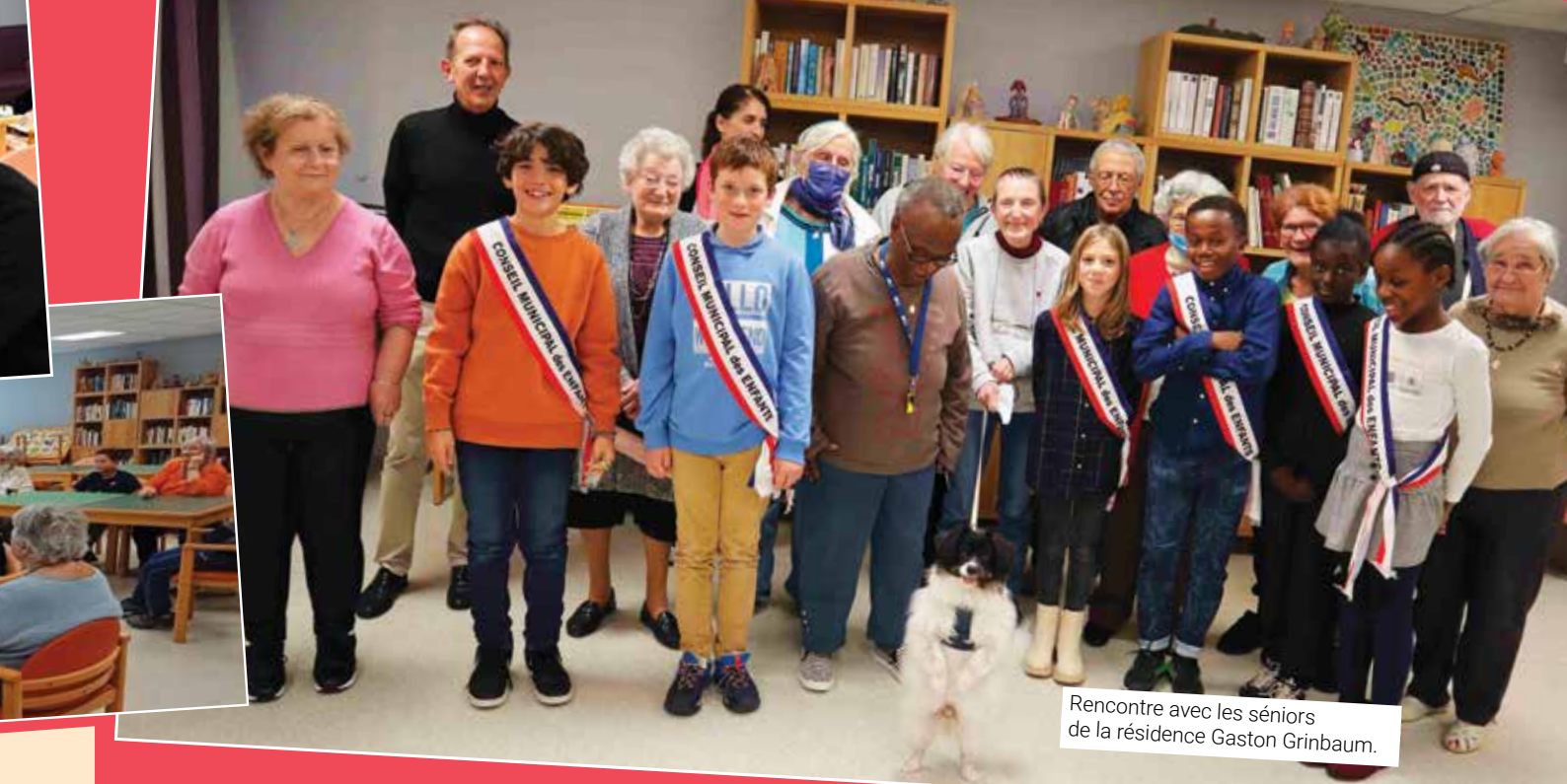
Rencontre avec les séniors de la résidence Gaston Grinbaum.