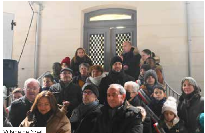
Village de Noël.