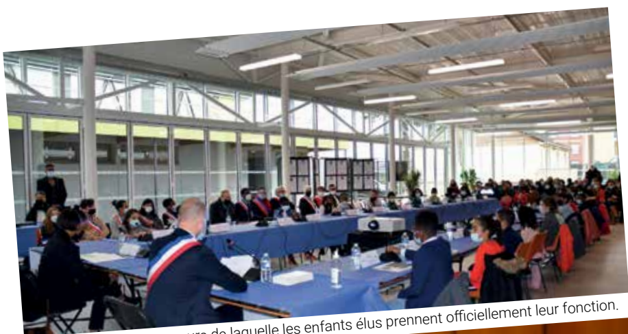
Séance d'investiture au cours de laquelle les enfants élus prennent officiellement leur fonction.

Trois séances plénières se sont déroulées en présence du Maire et/ou de son représentant