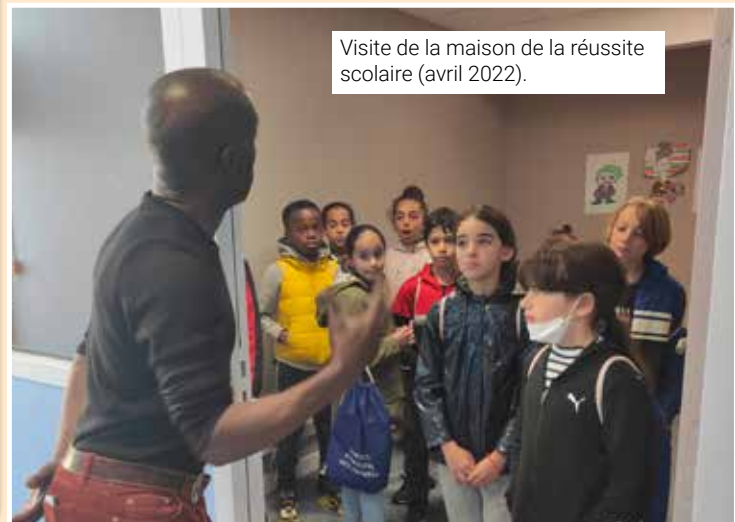
Visite de la maison de la réussite scolaire (avril 2022).